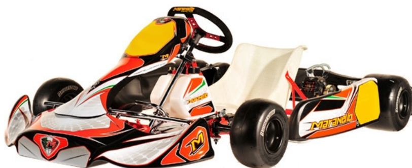
Podvozek Maranello RS12 LS – Premier line